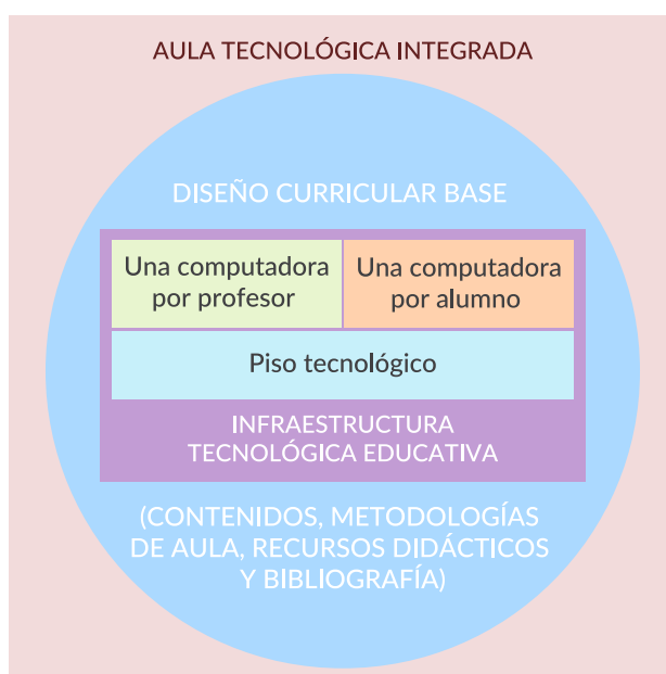
Gráfico 1. Modelo conceptual de solución tecnológica