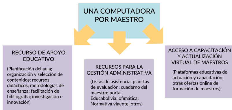
Gráfico 3. Usos de computadora entregadas a los maestros