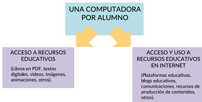
Gráfico 4. Usos de una computadora por alumno

La dotación de una computadora por alumno, facilita: i) el acceso a recursos educativos como libros en PDF, textos digitales, videos, imágenes, animaciones, entre otros y, ii) acceso a y uso de recursos educativos en internet como plataformas educativas gestionadas por estudiantes, blogs educativos, comunicaciones, recursos digitales de producción de contenidos entre otros. El Gráfico 4 muestra los usos mencionados.